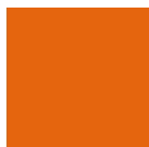
Verkehrsorange vergleichbar Ral 2009