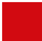
Verkehrsröt vergleichbar Ral 3020