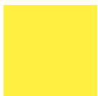
Zinkgelb vergleichbar Ral 1018