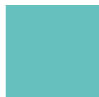
Lichtgrün vergleichbar Ral 6027